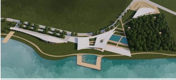
9.Aventura a due passi dal lago_Gruppo 11