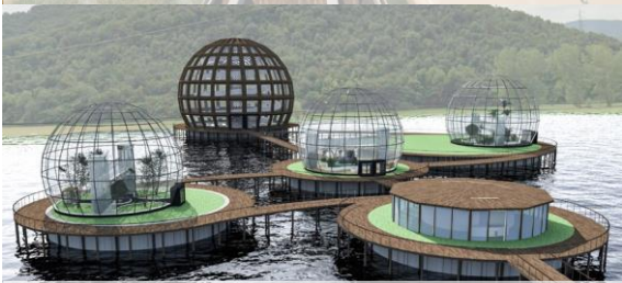
4.Floating Nature_Gruppo 10