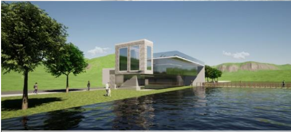
6.Walk lake_Gruppo 3