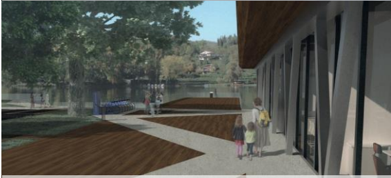
7.Waterscape Plaza_Gruppo 7