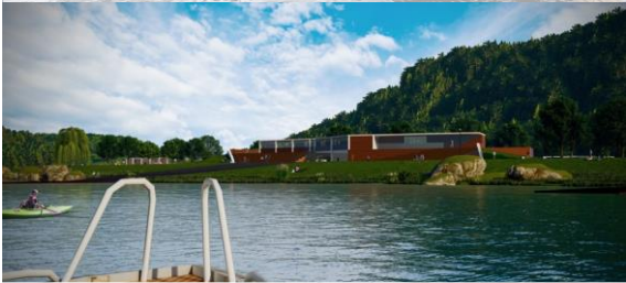
5.Canoa streets_Gruppo 6