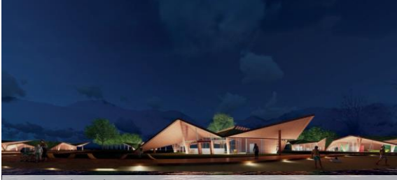
10.Lakeside Hub_Gruppo 5