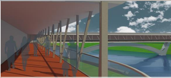
2.Connecting line_Gruppo 1